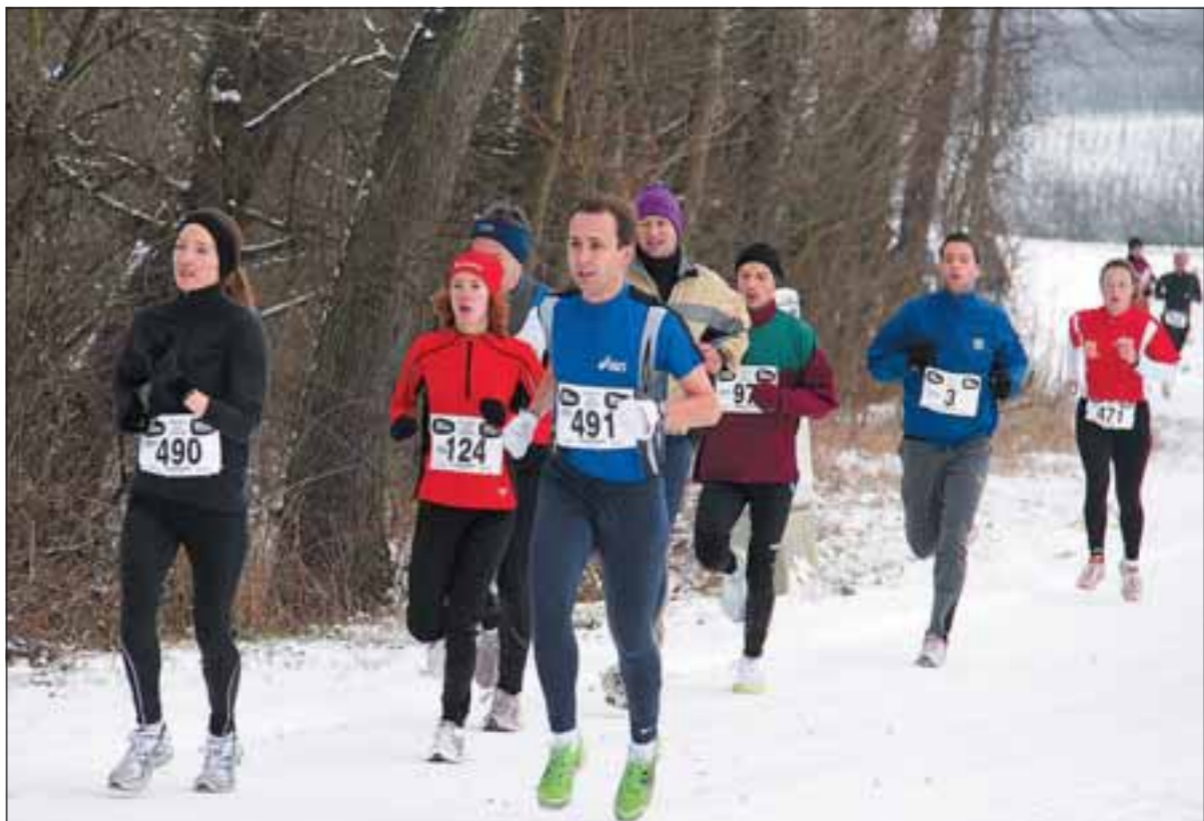
Durch eine winterlich verschneite Landschaft führte in diesem Jahr der Dreikönigslauf des Turnvereins Dielheim. Trotz der widrigen Verhältnisse nahmen 280 Sportler teil.