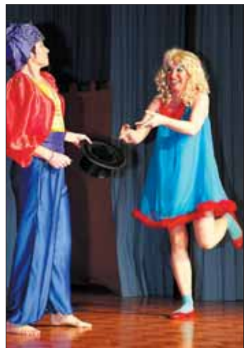
Die Frauen der Gruppe „Step & Power“ verwandelten sich in Zauberrinnen.

Dielheim. Erinnerungen an die Eröffnungsfeier der Olympischen Spiele 2008 in Peking wurden geweckt, als junge Trommlerinnen beim Bunten Abend des Turnvereins Dielheim ein rhythmisches Klangfeuerwerk entfachten. Die Damen von „Aerobic & More“ unter Leitung von Anette Müller bewegten sich in original chinesischen Kostümen in asiatischer Harmonie und Vollendung, hantierten mit „Drumsticks“, als wären diese kunstvolle Fächer oder leuchtende Esstäbchen, und beendeten ihre eindrucksvolle Show mit heißen Trommelwirbeln auf